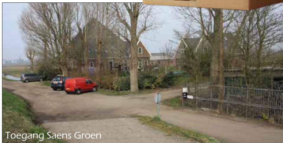
Toegang Saens Groen