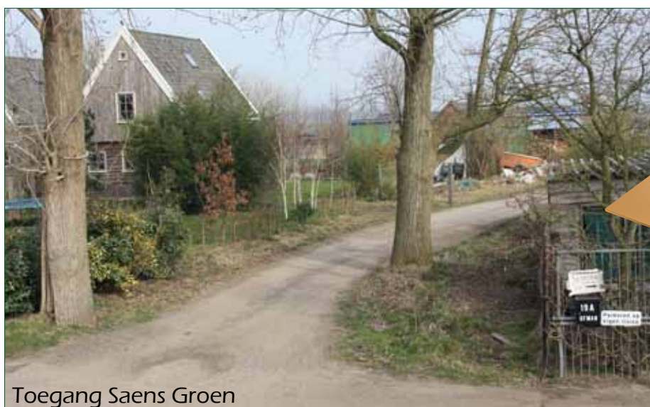
Toegang Saens Groen